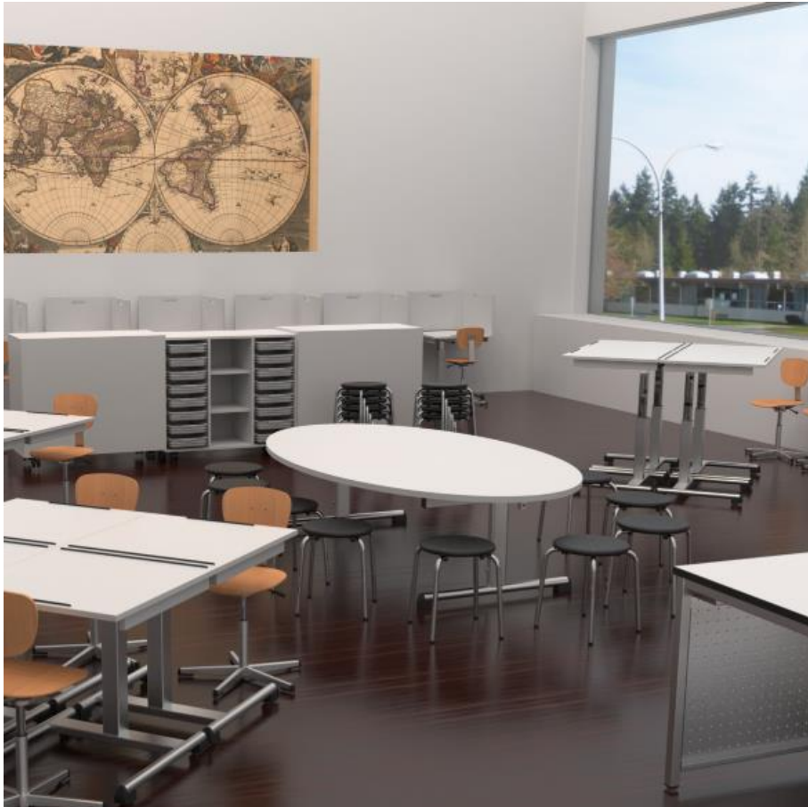
Table pour groupe ovale modèle de Coire avec réglage en hauteur