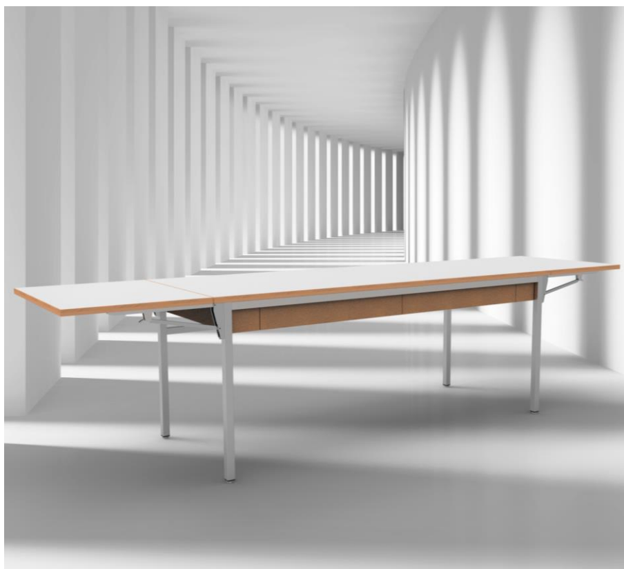
Table de travail et table pour textile