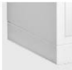
Sockel mit Nivelliergleitern