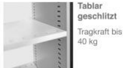
Tablar geschlitz Tragkraft bis 40 kg