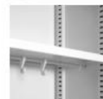
Huttablar mit Kleiderstange