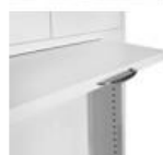
Zwischenrahmen mit Auszugstabil inkl. Bügelgriff