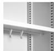
Huttablar mit Kleiderstange