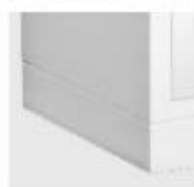
Sockel mit Nivellierergleiter