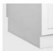
Sockel zurück stehend oder rundum bündig