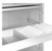
Ausziehbare Schublade (Zubehör siehe Korpusse)